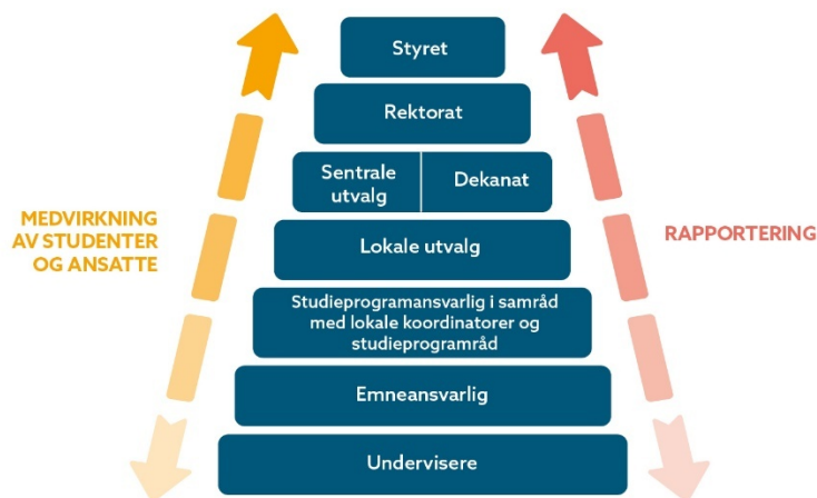
Figur 3. Nords modell av rapporteringslinjene