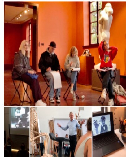
Fra undervisningen i september 2020. Fotokollasje.