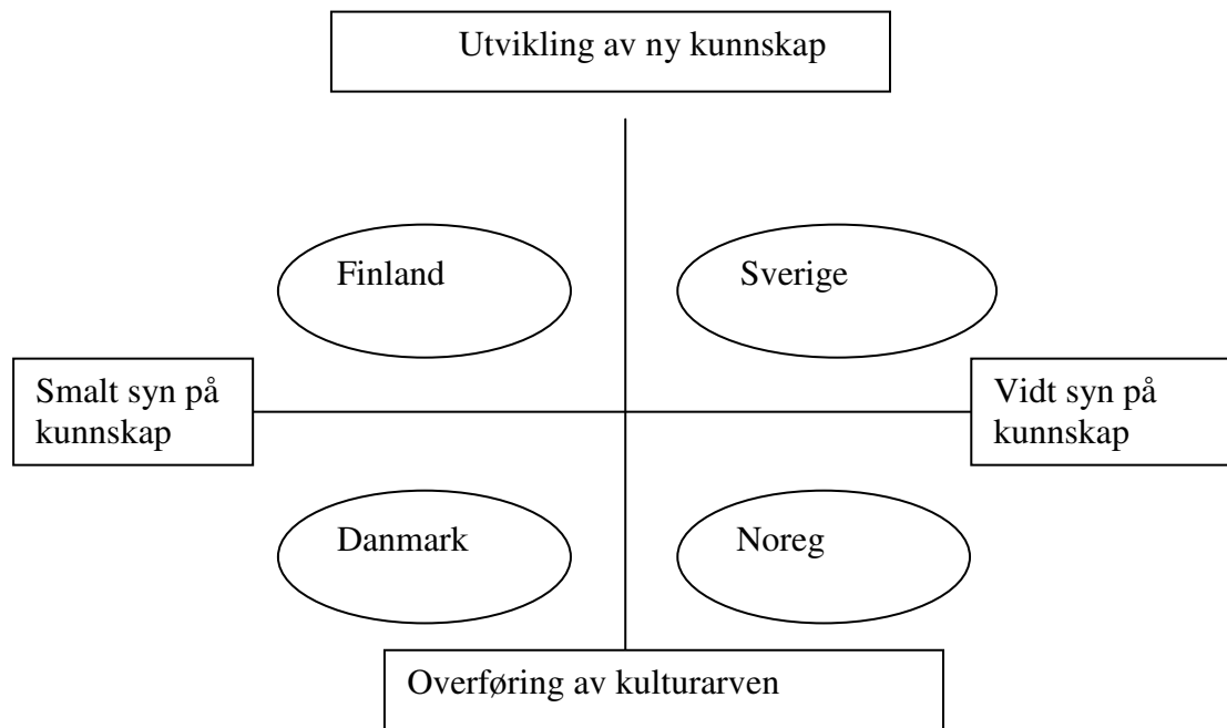
Figur nr. 2: Undervisningskulturen i fire nordiske land (Klette m.fl. 2002).

Figuren inneheld to dimensjonar. Den horisontale er syn på kunnskap, smalt og vidt. Definisjonen av kategoriane er uklar, men vidt syn er karakterisert av ulike kunnskapsformer. Den vertikale dimensjonen handlar om kva som er skulen si kunnskapsoppgåve: å utvikle ny kunnskap som er det eine ytterpunktet og overføre kunnskap som er det andre.